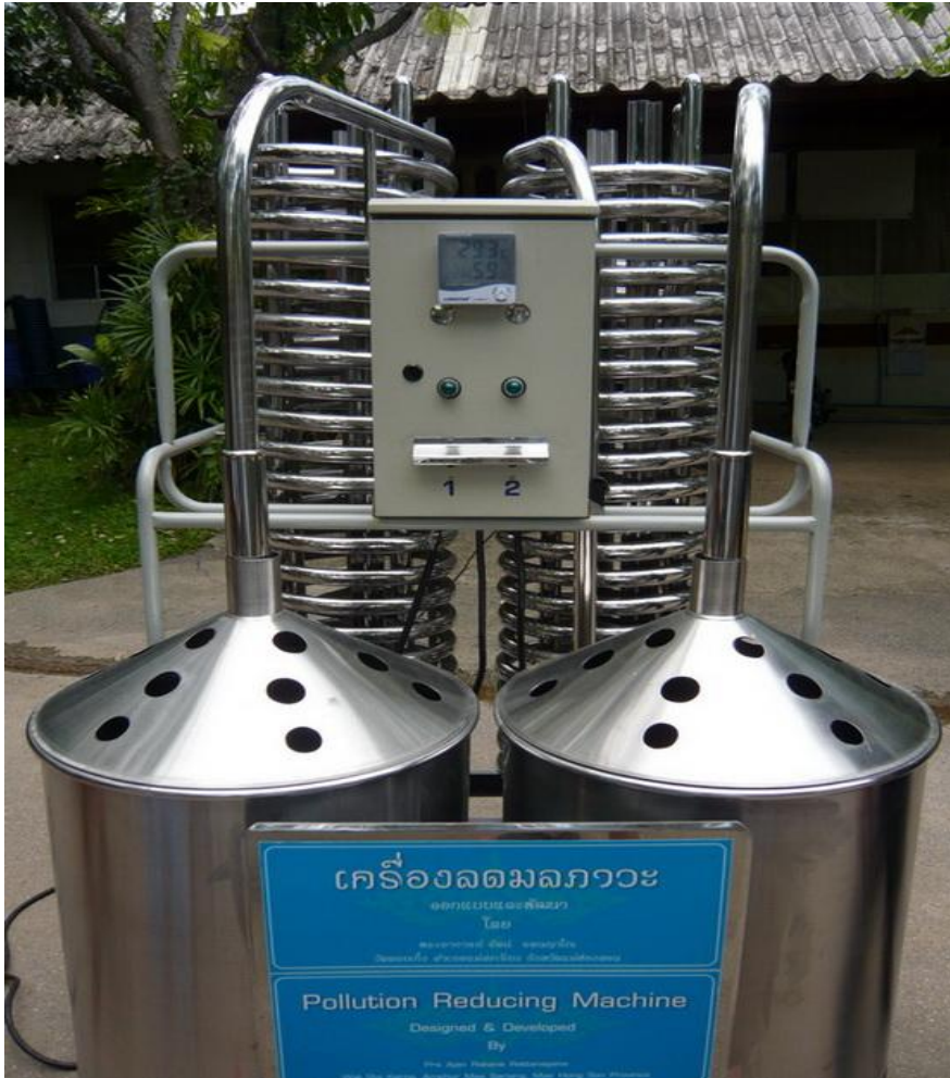
รูปของเครื่องลดมลภาวะ